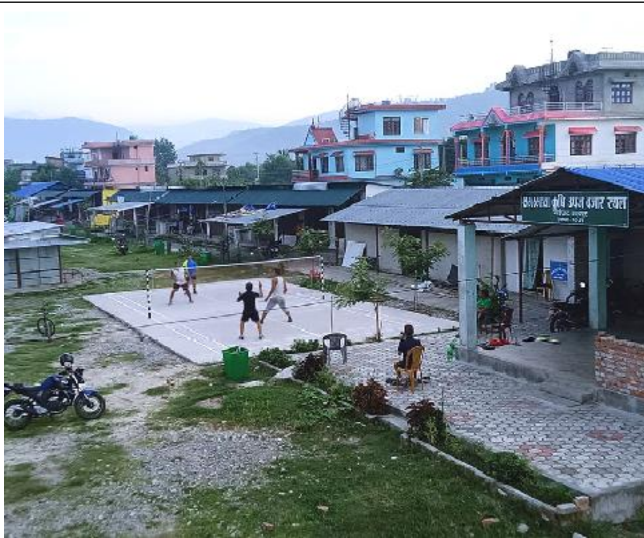
ब्याडमिन्टन खेलप्रति आकर्षण । उदयपुरको सदरमुकाम गाईघाट त्रियुगा नगरपालिका १३ पुरानो गाईघाट सब्जीबजारमा स्थित अस्थायी प्रहरी पोस्टमा रहेको ब्याडमिन्टन कोर्टमा ब्याडमिन्टन खेल्दै स्थानीयहरु ।

अस्पतालको स्तरोन्नति र शल्यक्रियाका लागि आवश्यक सामग्रीलगायतमा नगरपालिकाले सबैखाले सहयोग गरिने बताएको छ। अस्पतालमा सामान्य सर्जरी, एपेन्डिसाइटिसको शल्यक्रिया, गर्भवती महिलाको बच्चा जन्माउने अप्रेसन सिएस पनि नियमित निःशुल्क सञ्चालन भइरहेको छ। शल्यक्रिया सुरु भएपछि उदयपुरका साथै छिमेकी सिन्धुली, खोटाङ, ओखलढुंगा, सोलुखुम्बुका महिलाले समेत अस्पतालबाट सेवा पाउनेछन्।